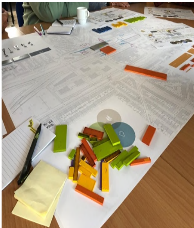
Figuur 1, bijeenkomst adviesgroep 2.